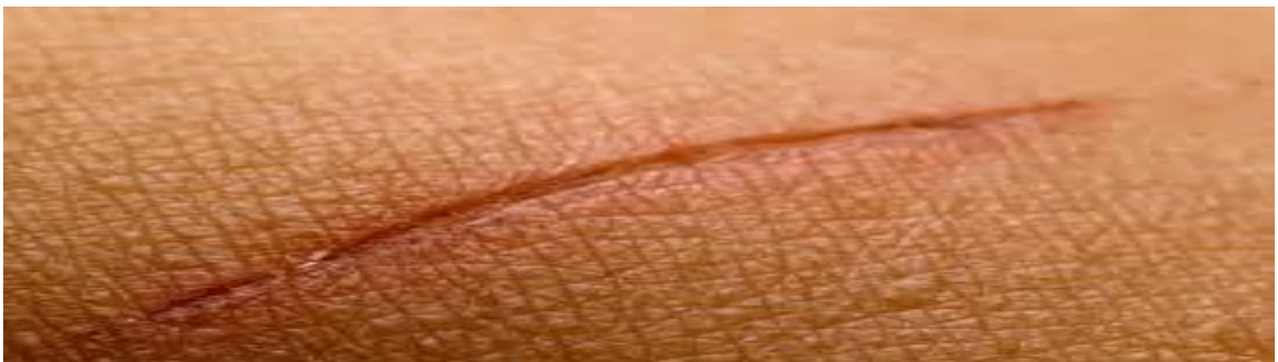
Figura N°3 Exoinfección Quirúrgica.

Al hacer referencia a la exoinfección quirúrgica a la sepsis focal y/o general producida a raíz de un acto quirúrgico en un medio quirúrgico, por invasión del o de los gérmenes que rodean al enfermo en su hábitat y que alcanzan al huésped por diferentes vías, sean a erógenas, digestivas, por inoculación o por contacto íntimo. Las infecciones postquirúrgicas se sintetizan en tres síndromes: infeccioso focal, infeccioso general, bacteriano sin sepsis e infeccioso focal, se produce cuando una asociación de gérmenes bacterianos, cocos Gram positivos o gramnegativos o bien colonias mono bacterianas: estreptococos, estafilococos, piociánicos, aerobacter, proteus, etc. desencadenan la supuración de la herida operatoria. A esto se puede agregar las miopatías como simple asociación, o asociación más infección micótica: candidas, aspergillus o macor.