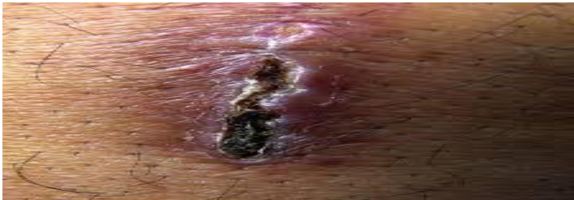
Figura N° 2 Infecciones en Cirugía